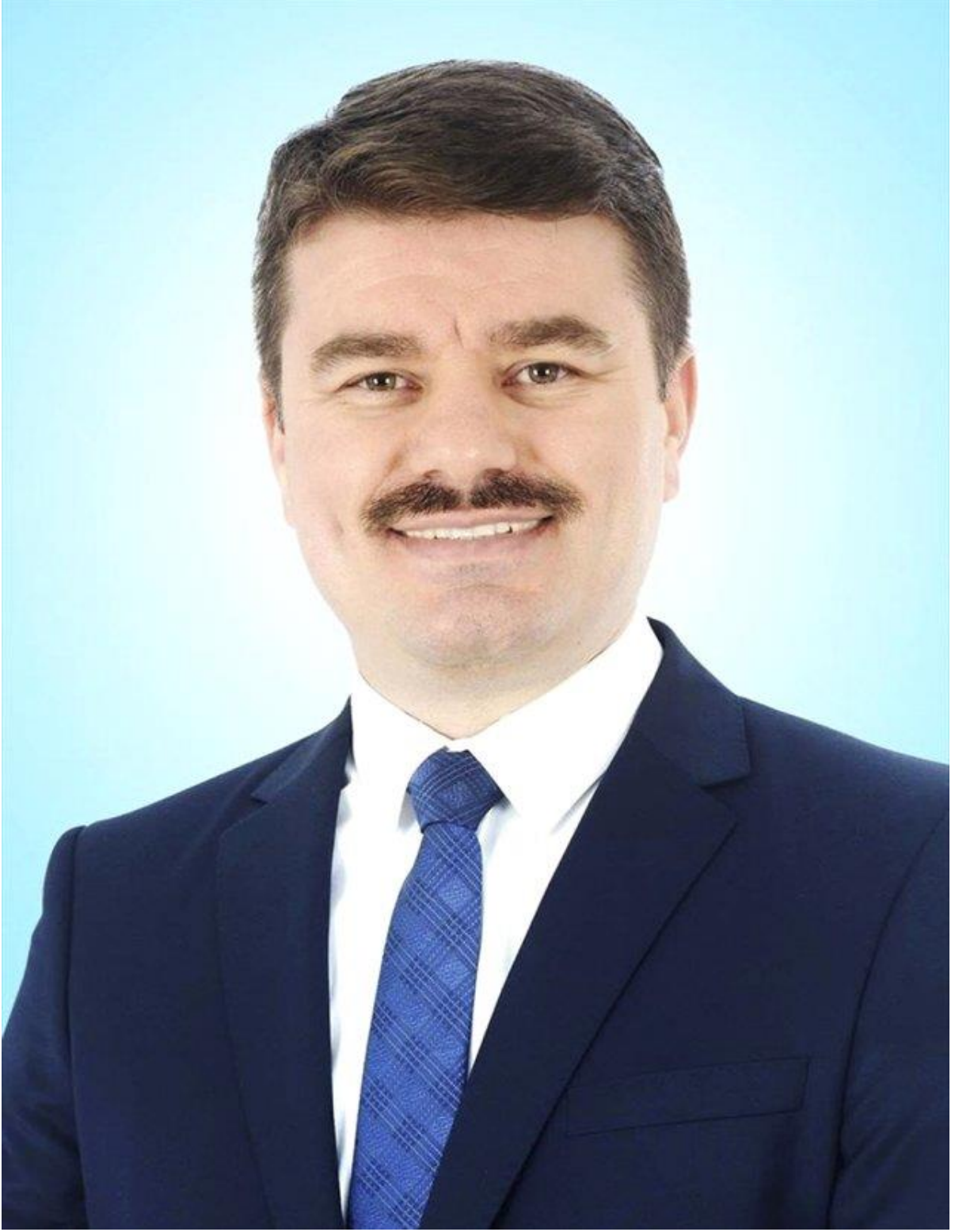
Evren DİNÇER Aksaray Belediye Başkanı